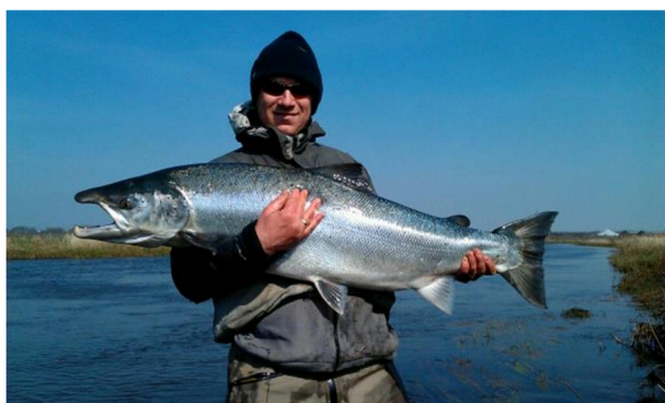
Øverst: fra Skjern Å største fluefangede laks i Danmark på 121cm og 20,4kg.